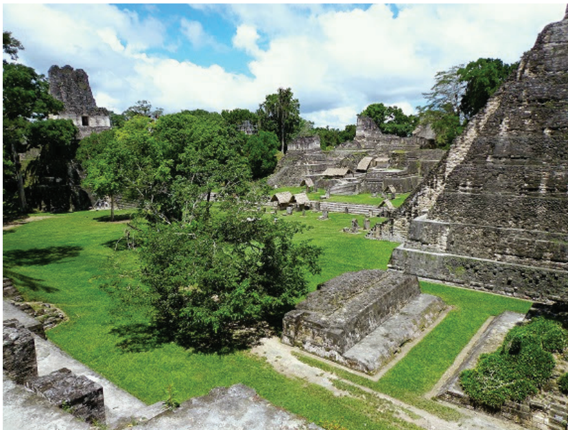
Jessica Galindo JG Photo

¿Entonces cual es la diferencia entre paisaje natural y el paisaje cultural?