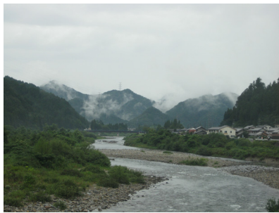
Mino : Lugar en Japón donde están las plantaciones de la fibra Kozo