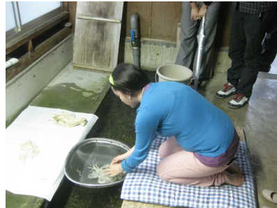
Limpieza en agua para retirar impurezas