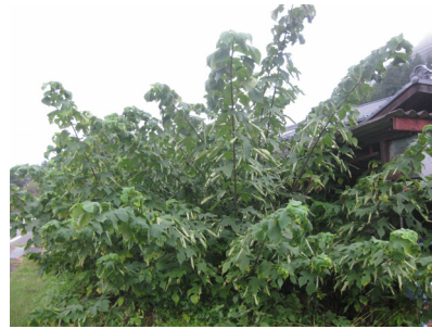
Plantación de la Fibra Kozo