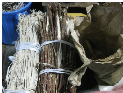
Proceso de secado y cocción