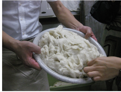
La mezcla es agregada y batida en agua, con adhesivos vegetales, listo para elabora hojas de papel.